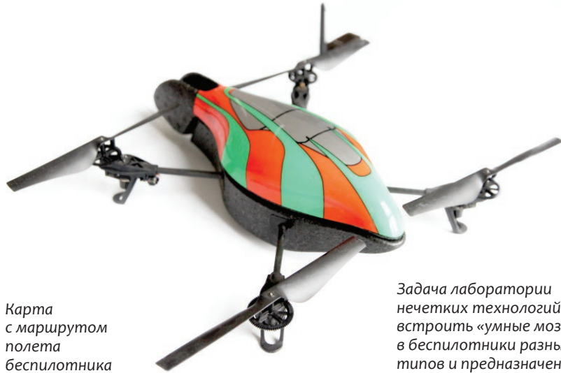
Задача лаборатории нечетких технологий — встроить «умные мозги» в беспилотники разных типов и предназначений

По аддитивным технологиям сейчас в России создается несколько типов кластеров или сообществ. Есть такой кластер и у нас. В него входят четыре академических института, Новосибирский государственный технический университет и несколько промышленных предприятий. Он отличается от всех остальных тем, что мы сориентированы на изготовление отечественных машин и порошков. Мы хотим сделать все целиком свое. И мы это сделать можем. Использование аддитивных технологий открывает перед человечеством принципиально новые возможности. Это создание материалов с иными, крайне сложными формами и новыми свойствами, с помощью которых возможно многое, включая уникальное протезирование в медицине. ■