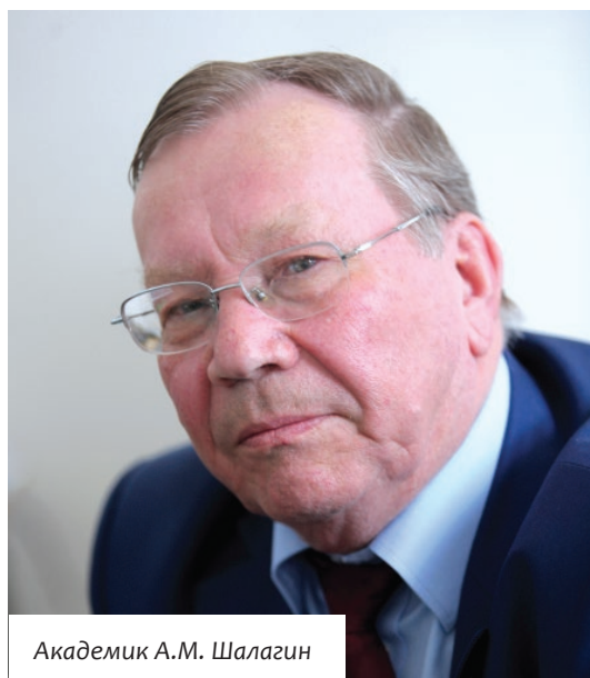
Академик А.М. Шалагин

установки по распознаванию предметов и людей, маленькие летающие самолетики и виртуальные кабины пилотов, позволяющие почувствовать себя завоевателем пространства... Ученые — это и есть настоящие волшебники, которым покоряются самые невероятные задачи.